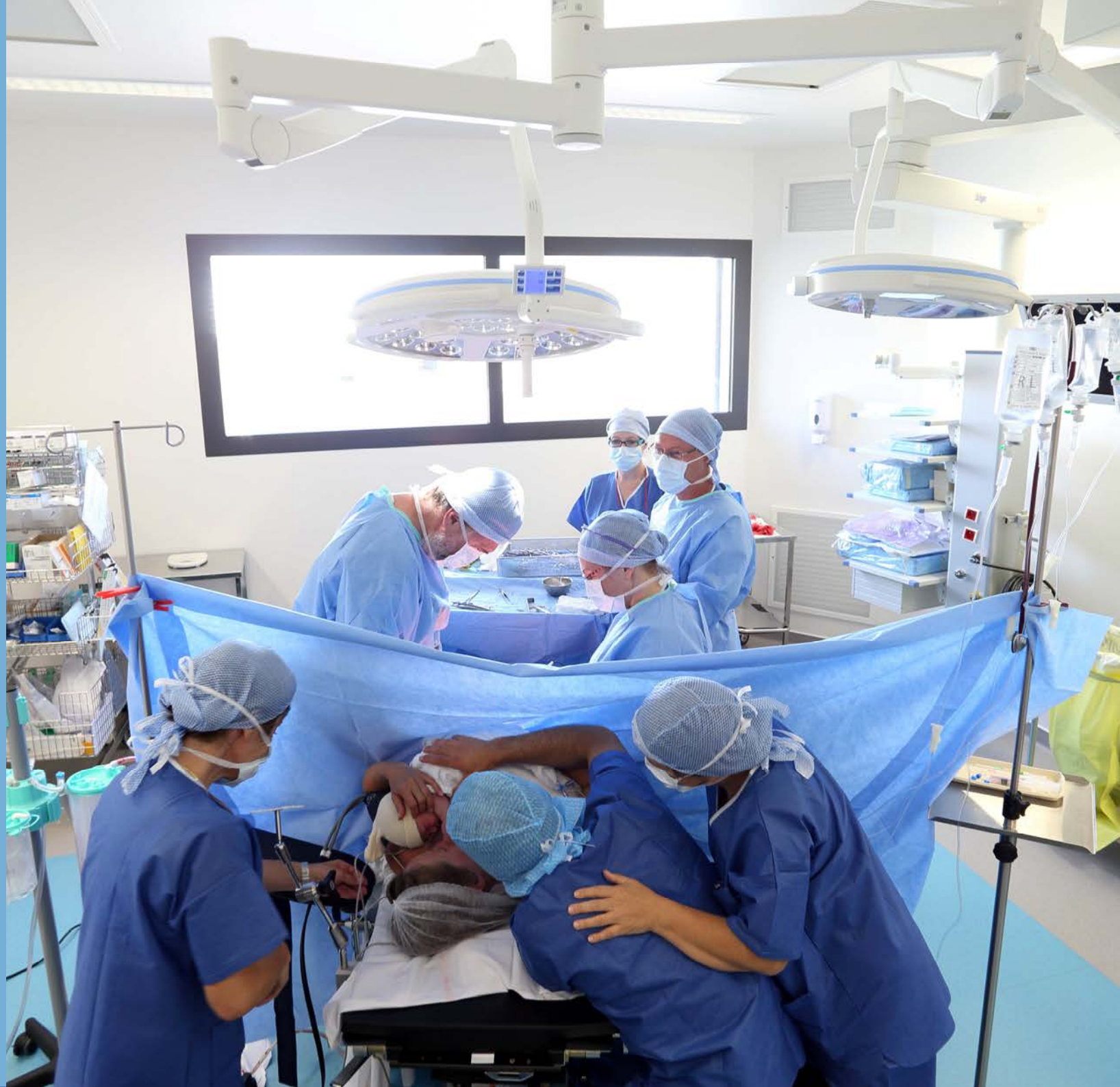
Peau à peau après césarienne en présence du père, à la maternité d'Arcachon.

Dr Amblard : Beaucoup de pratiques préconisées par l'IHAB se répandent peu à peu mais les professionnels ignorent souvent que la démarche va bien au-delà de l'allaitement et s'adresse tout autant aux mamans qui font le choix du biberon. C'est une démarche exigeante, qui oblige à se remettre en question sans cesse et à se positionner à l'avant-garde.